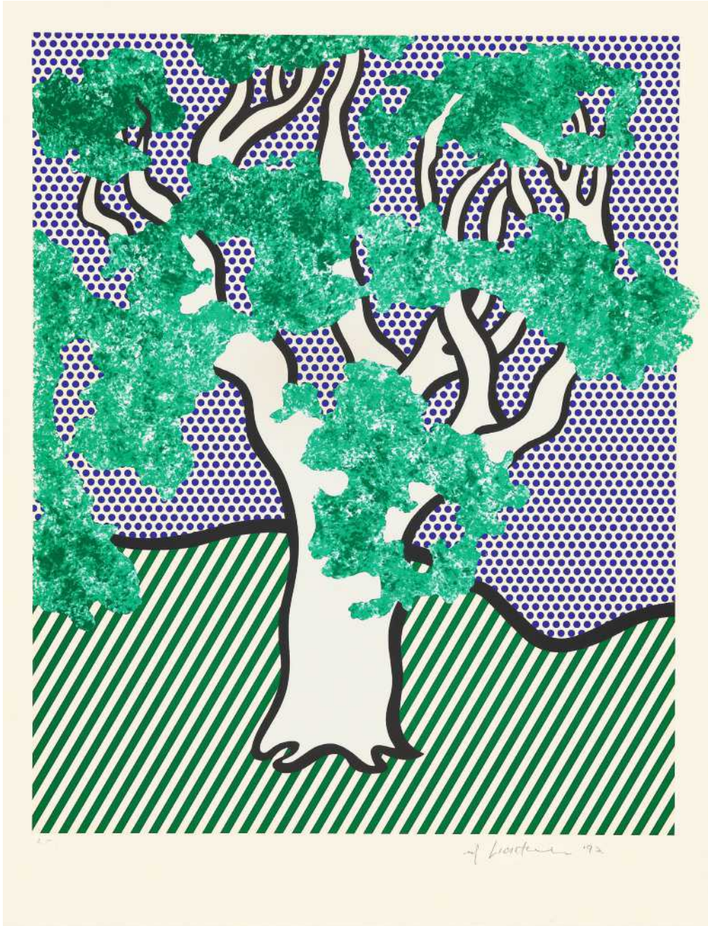
Bild links: © Estate of Roy Lichtenstein/ VG Bild-Kunst, Bonn 2020; Bilder rechts: Minjung Kim und Courtesy Galerie Commetter; Kunkel Fine Art